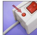
resetowalny bezpiecznik 10A