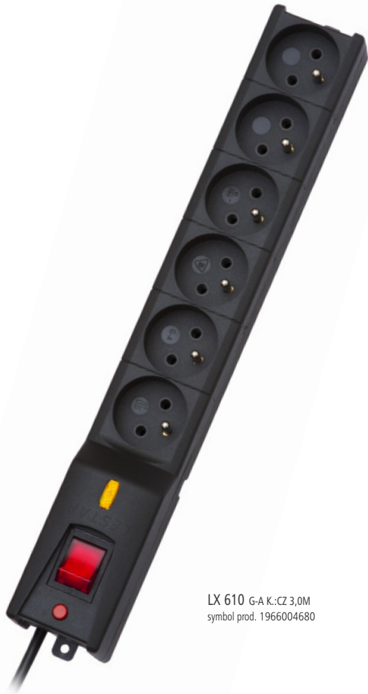
LX 610 G-A K.:CZ 3,0M symbol prod. 1966004680