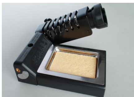
28. Podstawka do lutownicy z gąbką