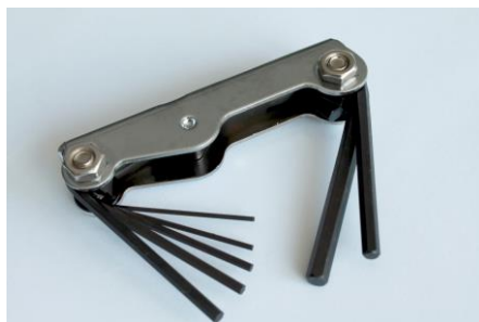
23. Zestaw kluczy sześciokątnych wielkość: 1,3; 1,5; 2; 2,5; 3; 4; 5