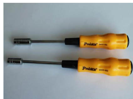
27. Wkrętaki końcówkami Nasadowymi 5 i 6mm