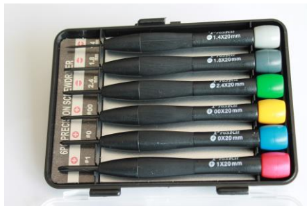
22. Zestaw wkręteków precyzyjnych