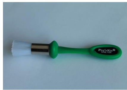
12. Szczotka antystatyczna