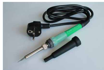
20. Lutownica 12W