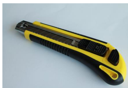
15. Nóż z wymiennymi ostrzami