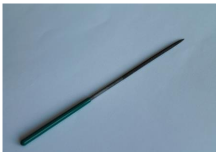
10. Pilnik Iglak okrągły