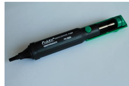
18. Odsysacz cyny