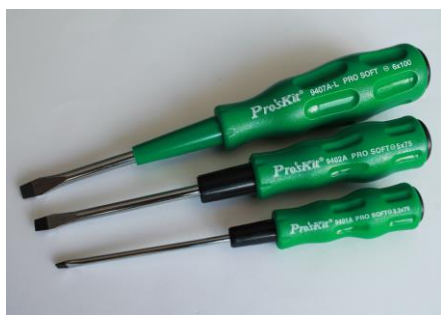
26. Wkrętaki płaskie 3,2; 5; 6 mm