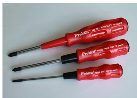
25. Wkrętaki krzyżowe PH0; PH1; PH2