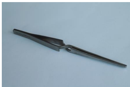
19. Pęseta odwrótne