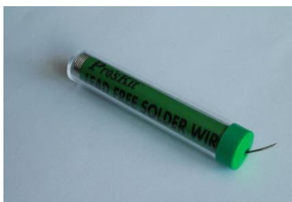
14. Spoiwo lutownicze