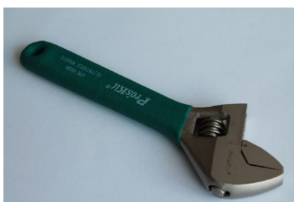
13. Klucz nastawny