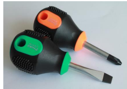
24. Wkrętaki krótkie