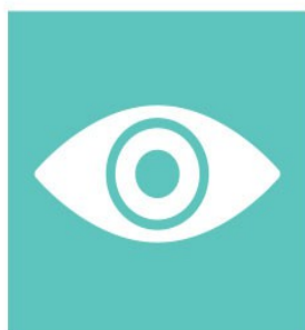
Security & Surveillance