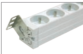
Listwa zasilająca 19" z możliwością montażu w 12 płaszczyznach