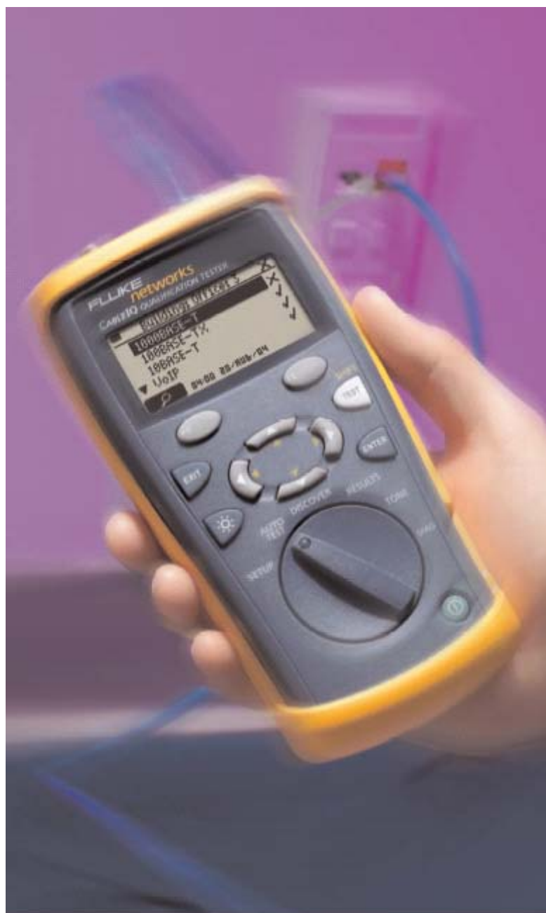
CableIQ™ Qualification Tester

CableIQ jest łatwym w użyciu testerem pozwalającym na wyszukiwanie problemów związanych z kablem oraz do kwalifikacji przepustowości kabla. Tester ten posiada w sobie wszystko , co jest potrzebne do sprawdzenia, czy Twój kabel jest w stanie współpracować z sieciami 10/100, VoIP czy też Gigabit Ethernet oraz szybko rozwiązać problemy z łącznością sieci. Wszystko to w jednym intuicyjnym podręcznym urządzeniu.